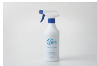
充填用スプレーボトル