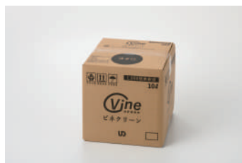
ビネクリーン希釈液