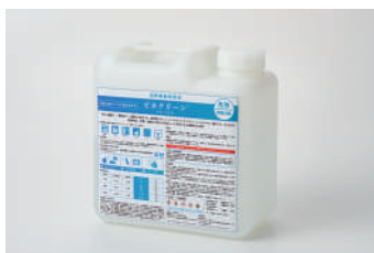
ビネクリーン原液