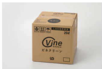
ビネクリーン希釈液